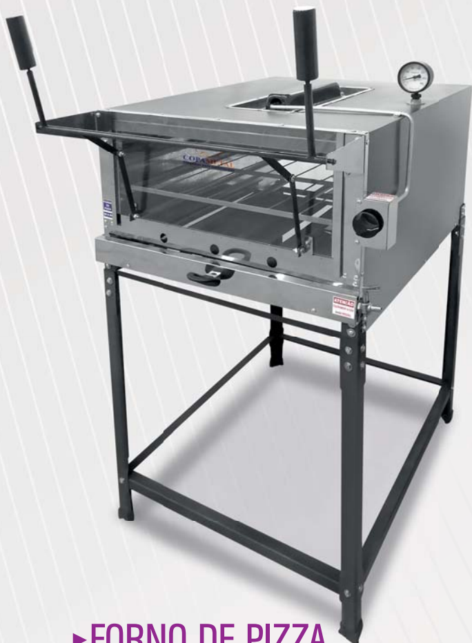
► FORNO DE PIZZA A GÁS