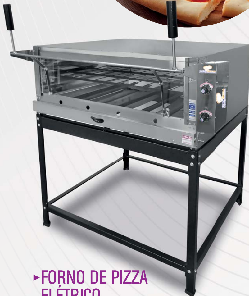
► FORNO DE PIZZA ELÉTRICO